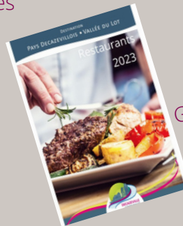
Guide des restaurants

Toutes nos éditions sont également téléchargeables en ligne sur www.tourisme-paysdecazevillois.fr