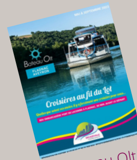
Bateau Olt 12 000 ex.