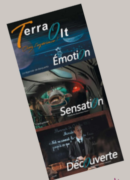
Terra Olt 5 000 ex.