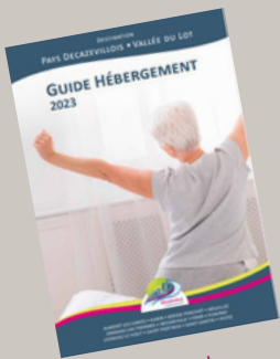
Guide Hébergement 1500 ex.