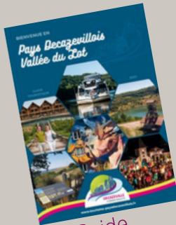
Guide Touristique 7000 ex.