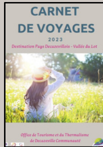
Carnet de voyages numérique